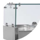
Structure en verre pour protéger les aliments